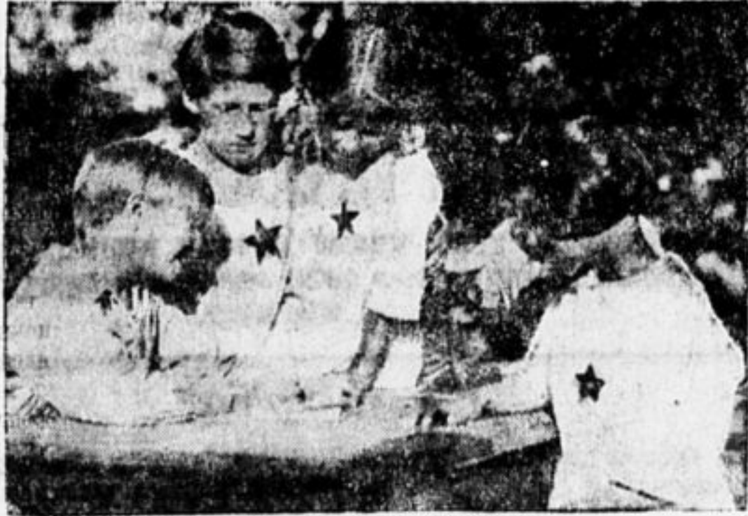
ОКТАБРЕТА ПИШУТ В СТЕНГАЗ.

Теперь наши ребята уже свободны и работа среди октябрят закипит. Н. ИЛЬИНОВ.